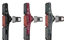
KS-TEC KS-TECR KS-TECS