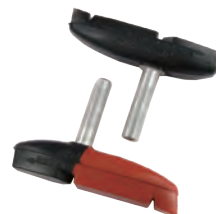
* Eagle2 无牙杆