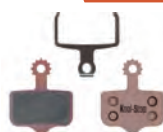
D296S AVID ELIXIR 1, 3, 5, 7, XO, XX, SRAM DB XO X7 X9 XX